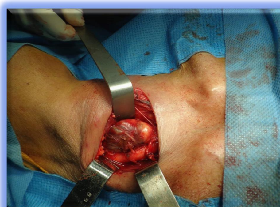
Exploration peropératoire : formation latérotrachéale dont la malignité est fortement évoquée